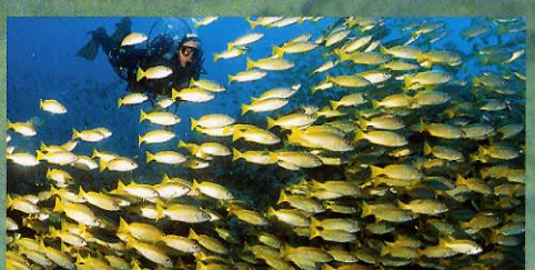
Einmalig: Khao Lak